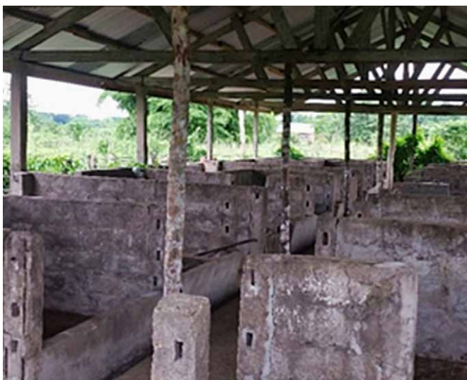
Fig. 3 : Porcheries de l'INERA

Les résultats de l'étude montrent également une régression du potentiel génétique des animaux. En effet, les éleveurs vendent généralement en premier les mâles et ceux à croissance rapide. Par conséquent, la reproduction a lieu majoritairement au sein d'une même lignée augmentant le taux de consanguinité. Il en résulte une hausse du taux de mortalité et une diminution de la taille des animaux.