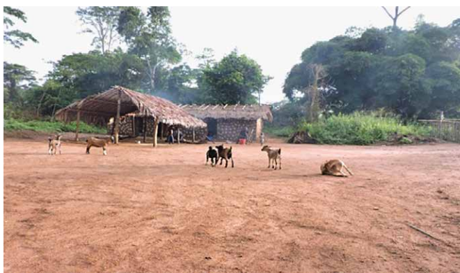
Fig. 2 : Chèvres en divagation dans un village.

La République Démocratique du Congo (RDC) dispose d'un potentiel agricole estimé à 80.000.000 d'hectares de terres arables et d'importantes superficies de pâturages pour l'élevage. Malgré ce tableau éloquent, le pays est classé parmi les plus pauvres du monde.