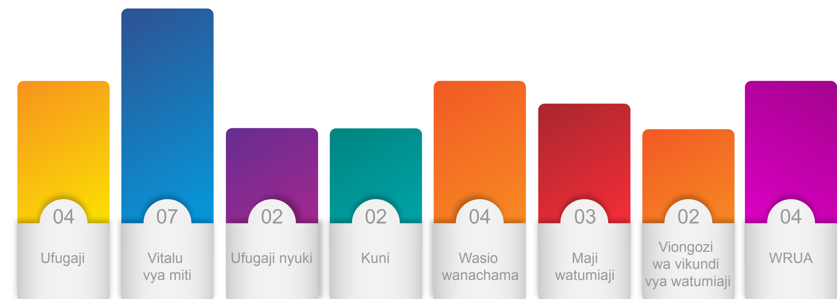
Kielelezo 3. Idadi ya mijadala ya vikundi maalum kwa kila kikundi cha watumiaji Itare