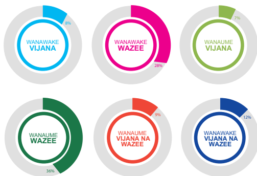
Kielelezo 2. Asilimia ya washiriki wanawake na wanaume katika majadiliano ya vikundi maalum.