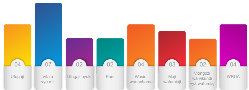
Kielelezo 3. Idadi ya mijadala ya vikundi maalum kwa kila kikundi cha watumiaji Itare