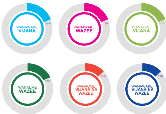
Kielelezo 1. Asilimia ya washiriki wanaume na wanawake katika mijadala ya vikundi maalum.

Vyama viwili vya kijamii (CBO) chini ya CFA (Borop na Tulwap) vilichaguliwa. Tulichagua makundi ya watumiaji yafuatayo: ufugaji, usimamizi wa maji, vitalu vya miti, ufugaji wa nyuki na ukusanyaji kuni. Tulifanya mijadala ya vikundi maalum (focus group discussions) 38 na wanachama na wasio wanachama wa CFA, na mahojiano muhimu na wenye ufahamu wa kutosha kuhusu mambo katika jamii (key informant interviews) 6 na viongozi wa vikundi vya watumiaji na WRUA. Tulijadiliana na wanaume na wanawake 371 kwa jumla ambao walitenganishwa kwa umri kama inavyoonyeshwa kwenye Kielelezo 1.