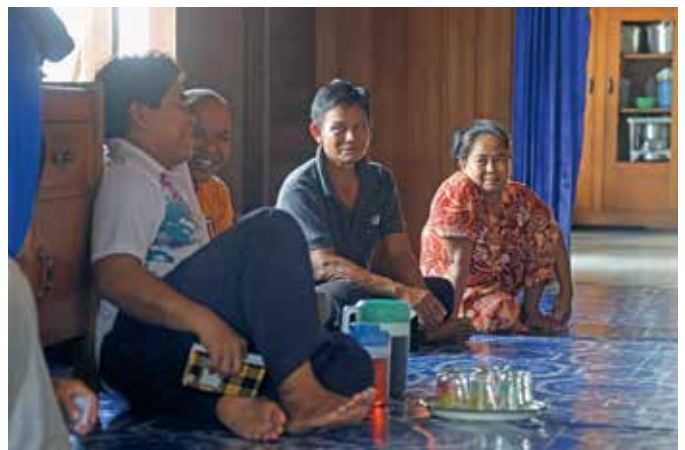
Habitantes en una discusión sobre planificación de medios de vida, poblado de Petak Puti, sitio de KFCP, Kalimantan Central.