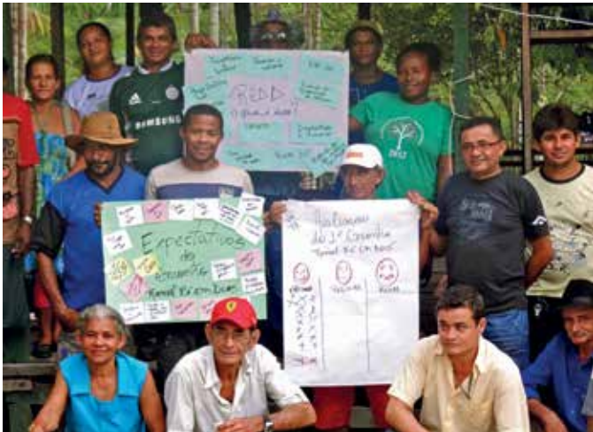
Taller participativo para trabajar en los conceptos de REDD+, proyecto Jari/Amapá, Amapá, Brasil.