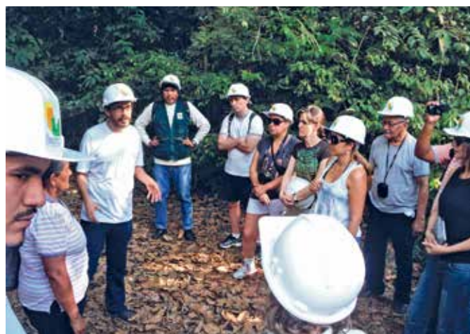
Visita de campo durante la reunión anual del Grupo de Trabajo de Gobernadores sobre Cambio Climático y Bosques, sitio de BAM, Madre de Dios, Perú.