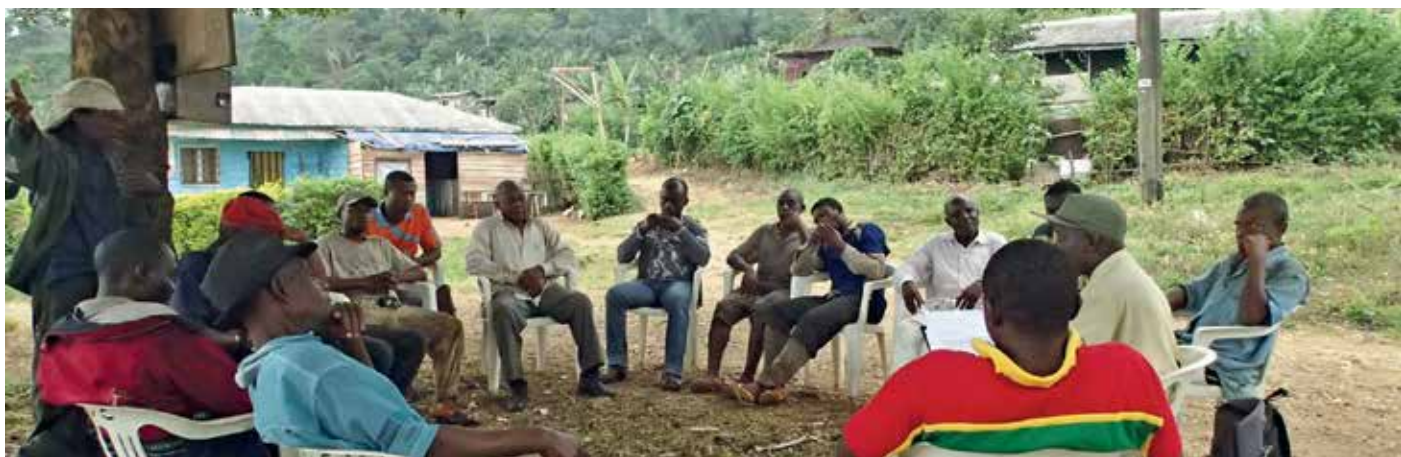
Reunión de grupo focal durante la recopilación de datos realizada por CIFOR en el sitio del monte Camerún, Likombe, Camerún.