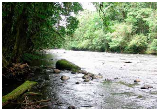
Las cuencas hidrográficas boscosas regulan el agua y protegen los suelos reduciendo los impactos climáticos

Un proyecto de regeneración y plantación forestal en Bolivia ha mostrado una reducción en la vulnerabilidad a la lluvia irregular y a tormentas intensas de las comunidades de Khuluyo. 21 Las comunidades locales dependen de la irrigación para la agricultura además de que las tormentas frecuentes causan la erosión del suelo y deslizamientos de tierra. El fomento de la regeneración natural de los bosques ha mejorado el suministro