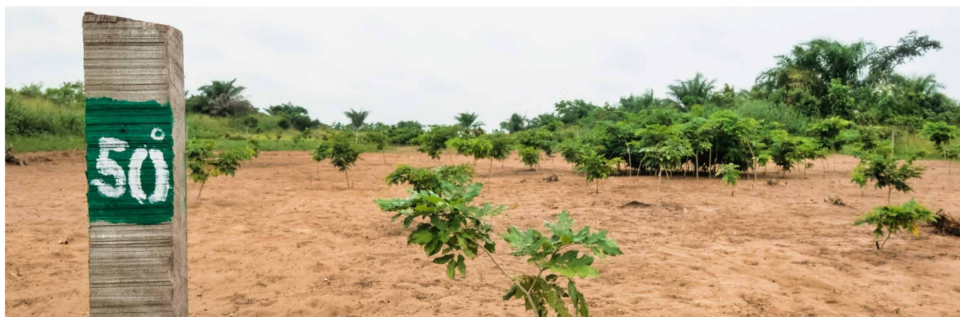
Efforts de reboisement en République démocratique du Congo.

Contributeurs : Raphael Tsanga (1), Mbonayem Liboum (1), Abdon Awono (1), Lydie Flora Essamba (1), Quentin Jungers (5), Florence Palla (6)