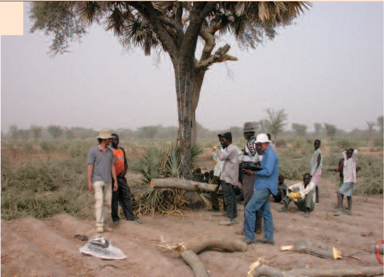
Élaboration de relations allométriques pour Faidherbia albida dans le Nord-Cameroun.