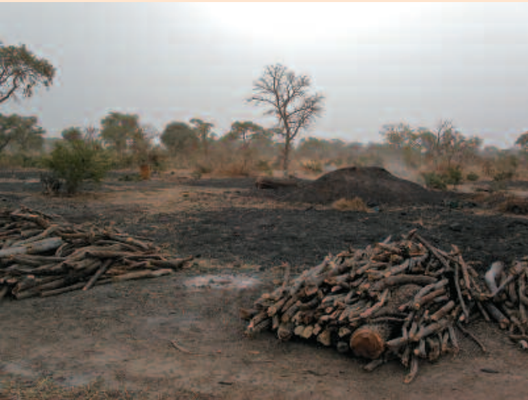
Exploitation du bois de feu et carbonisation à Korokoro (Mali).