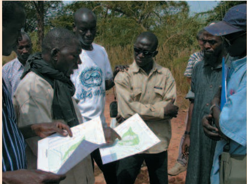
Présentation par le bureau d'études Agefore aux participants de l'école-chercheurs Savafor d'un inventaire forestier réalisé près de Siby (Mali).

Dans un effort de synthèse pour capitaliser les résultats de la recherche sur la productivité des savanes à l'échelle régionale, une école-chercheurs, baptisée Savafor, s'est rassemblée à Bamako au Mali, du 19 au 27 octobre 2005. Elle a réuni plus de 20 participants de la sous-région autour de communications orales, de débats (entre chercheurs et avec les acteurs du développement), de travaux communs sur des jeux de données et de sorties sur le terrain. Cette école-chercheurs avait deux objectifs : ▪ Faire le point sur les méthodes pour estimer la biomasse et la productivité des formations savaniques, en confrontant les expériences respectives de chercheurs de différents pays de l'Afrique de l'Ouest et centrale. ▪ Favoriser une synergie, à l'échelle régionale, entre les chercheurs travaillant sur le sujet. Le présent article vise à rendre compte des principales conclusions obtenues lors de cette école-chercheurs.