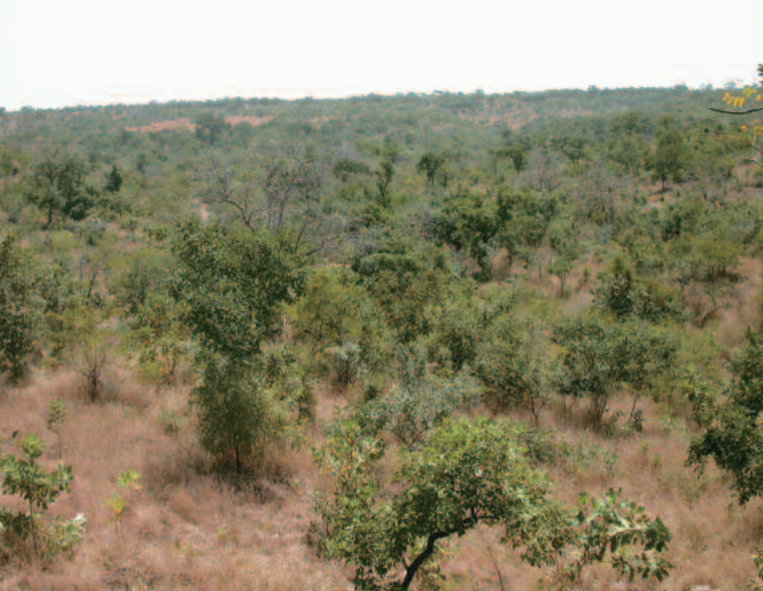
Savane arborée à Sokouna (Mali).

Les synthèses initiales de CLÉMENT (1982) et de la FAO (1984) ont été complétées par tout un ensemble d'études : POUPON (1979), GOUDET (1985), BONKOUNGOU, DE FRAMOND (1988), PELTIER, EYOG MATIG (1989), SAWADOGO et al. (2002), NOUVELLET (1992, 1993), CIRAD (1993), ICHAOU (1995), DEMBÉLÉ (1996), NTOUPKA (1999), NYGÅRD (2000), SAWADOGO (1996), etc. La formule de synthèse de CLÉMENT (1982), qui prédit la productivité en fonction de la pluviométrie annuelle, a longtemps été considérée comme la référence pour les aménagements. Toutefois, elle a montré ses limites face aux nouvelles données, comme le montre la figure 1. Cette figure révèle en effet la très grande variabilité des estimations de la productivité, qui peut varier d'un facteur six pour une même pluviométrie. Un examen plus attentif des données de productivité permet de dégager les enseignements suivants : ▪ L'estimation de la productivité dépend de la composante prise en compte : tout ou partie de l'arbre (différences entre petit bois et gros bois, entre parties aériennes et souterraines, etc.) ; sélection ou non des individus (selon une taille minimale d'inventaire, par exemple).