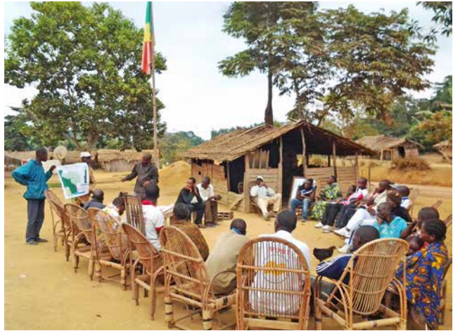
Réunion de concertation sur la zone délimitée en aire communautaire de chasse à Ingolo1

un autre type d'acteur. Une première amodiation d'une zone d'intérêt cynégétique pour la chasse sportive dans la concession forestière de la Congolaise Industrielle de Bois (CIB) a en effet eu lieu en 1999. Pour garantir les conditions d'une cohabitation harmonieuse, un protocole d'accord avait été signé entre CIB, WCS et un opérateur de chasse safari. La zone d'intérêt cynégétique avait été délimitée dans l'UFA Kabo. L'opérateur de chasse avait le droit d'organiser