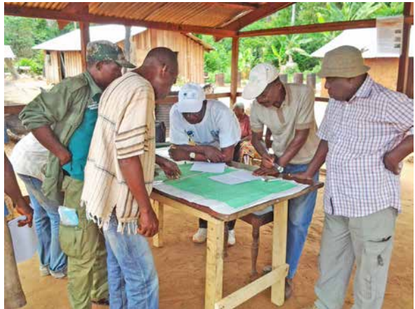
Séance de délimitation de l'aire communautaire de chasse de Liouesso

Le terroir de Liouesso est couvert par les forêts denses humides sempervirentes. Le diagnostic écologique réalisé en 2014 au moyen de caméras-pièges (Yapi 2014) a mis en évidence la présence d'une trentaine d'espèces animales. Les animaux les plus observés ont été les rongeurs (athérure et rat de Gambie), les céphalopodes (céphalopodes de Peter et bleu), les petits carnivores (mangouste à long museau et genettes), l'éléphant et le gorille. Les espèces intégralement protégées, notamment des grands singes