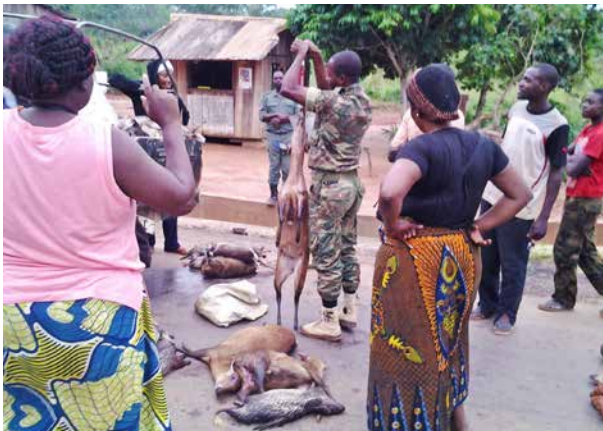
Contrôle et pesée du gibier en provenance des zones de chasse à la barrière des écogardes du PK 17 de Ouesso

Il est à noter qu'aucun permis de chasse n'a été délivré pendant la période d'ouverture de la chasse suivie en 2014 (du 1 er mai au 31 octobre 2014). Comme souligné à l'introduction du chapitre, aucun texte légal n'autorise le commerce de la viande de brousse au Congo, ni la perception de taxes associées à ce commerce. Ce vide juridique a amené les autorités locales du département de la Sangha à prendre des dispositions particulières, par une note de service,