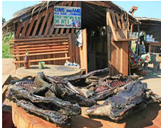
Commercialisation de viande de brousse dans le massif forestier du sud-ouest de la République centrafricaine

La prise en compte des aspects faunistiques, au sein des concessions forestières, a évolué sous la pression principalement des acteurs de la conservation. À la fin des années 1990, des ONG de conservation ont introduit le concept de «crise de viande de brousse» ( bushmeat crisis ), avec la création notamment de la Bushmeat Crisis Task Force (Fargeot 2013). Les entreprises concessionnaires ont été considérées comme indirectement responsables de la défaunation en facilitant l'accès aux braconniers par la création de routes et de pistes secondaires, ainsi que par le manque de contrôle de leurs ouvriers qui, parfois, participent