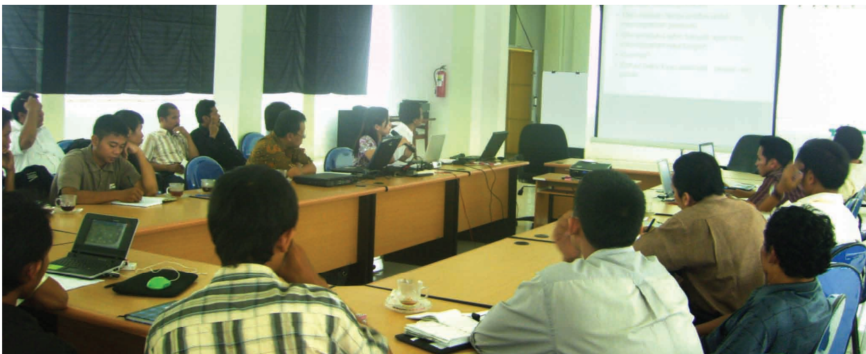
Lokakarya para pemangku kepentingan hari pertama (22 Desember 2008)

Makalah kedua berjudul "Sumber Kayu untuk Mebel Jati dan Mahoni Jepara". Tulisan ini menggambarkan kondisi industri mebel Jepara saat ini, yang menggambarkan keseimbangan antara persediaan dan permintaan, rantai distribusi bahan baku, serta persaingan antar industri mebel dalam mendapatkan bahan baku. Metode penelitian yang berkaitan dengan sumber bahan baku mebel kayu juga dituangkan dalam tulisan ini.