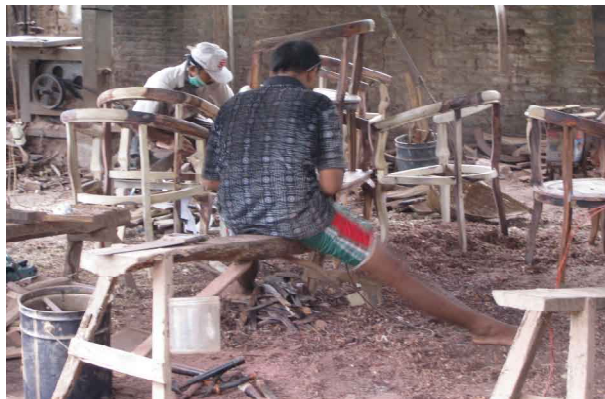
Suasana kerja di brak (bengkel kerja mebel)