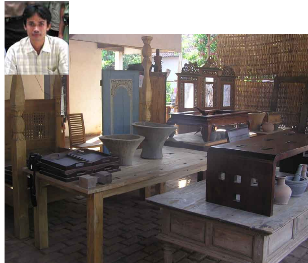
Suasana di Showroom Sulthon