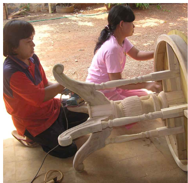
Pekerja wanita sedang melakukan finishing