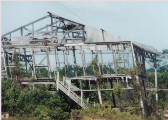
Bekas base-camp HPH PT. Keang Nam, Sumatera Utara yang dibakar masyarakat pada tahun 2001.

Sejak bergulirnya Era Reformasi, frekuensi konflik meningkat secara drastis. Proses desentralisasi yang terlalu cepat menimbulkan banyak ketidakjelasan sehingga memicu munculnya konflik laten dan merangsang terjadinya konflik baru. Pada saat ini konflik kehutanan merupakan kenyataan yang perlu dihadapi dan diselesaikan. Kini sudah waktunya untuk memasukkan rencana pengelolaan konflik sebagai salah satu syarat yang diwajibkan dalam pengelolaan hutan. Pengelolaan konflik yang baik dapat menciptakan transparansi dan keadilan dalam