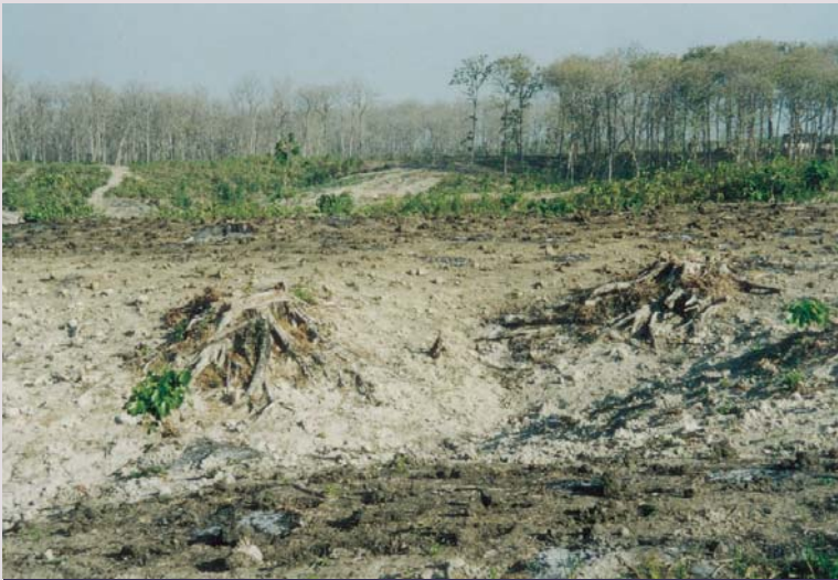
Kawasan hutan jati Perhutani di Randublatung yang habis dijarah.