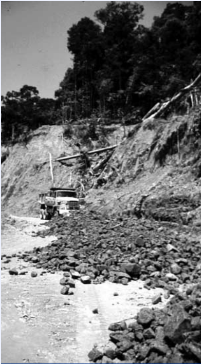
Dampak eksploitasi hutan

Dampak IPPK terhadap hutan juga berkaitan dengan jangka waktu ijin pemanfaatan. Karena jangka waktu IPPK dan sejenisnya biasanya hanya satu tahun, perusahaan penebang akan bekerja dengan cepat tanpa terlalu memperhatikan syarat-syarat kelestarian dan keamanan lingkungan. Akibatnya, jalan-jalan dibuat asal dorong dengan alat berat sehingga menyebabkan erosi dan longsor dan atau kekeruhan di sungai-sungai. Apalagi, IPPK tidak diharuskan melaksanakan rehabilitasi ataupun penanaman. Bila IPPK diberikan pada areal HPH maka kemungkinan besar yang ditebang justru sisa tebangan HPH yang diperuntukkan untuk permudaan. Di Barito Selatan, misalnya, karena sudah habisnya pohon ukuran besar, pohon-pohon kecilpun ditebas.