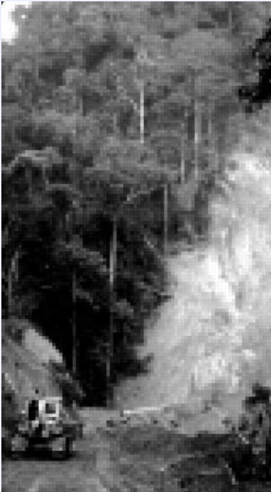
Pemanfaatan hutan dianggap hanya kayu

luar hutan negara. Kenyataan, kebanyakan wilayah yang ditunjuk sebagai wilayah usaha IPPK dan sejenisnya, secara hukum formal, adalah kawasan hutan negara.