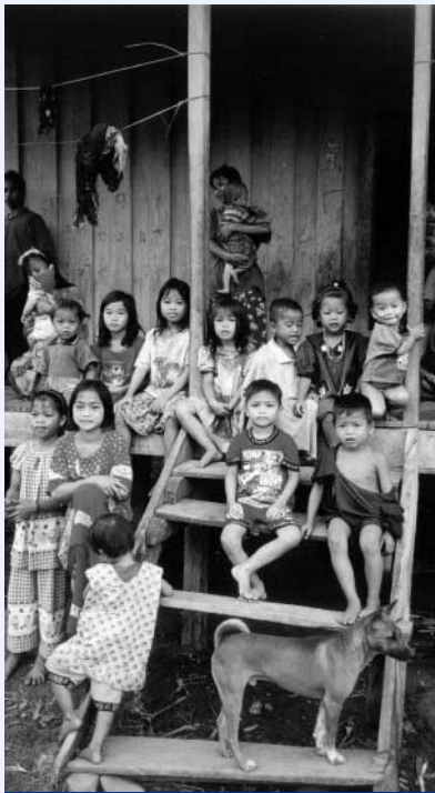
Generasi mendatang yang menanggung akibat desentralisasi

memenuhi janji sama sekali seperti halnya CV Sebuku Lestari di desa Bila Bekayuk Kabupaten Malinau.