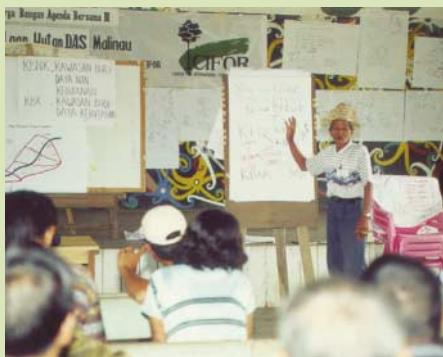
Salah satu peran serta masyarakat dalam penataan ruang

Memang tata ruang tidak akan memadai jika hanya mempertimbangkan aspek fisik, kecenderungan perkembangan dan minat investor. Tanpa memperhatikan aspirasi masyarakat setempat, tata ruang tak akan bermanfaat. Tata ruang yang direncanakan dan ditetapkan tanpa peran serta ataupun diketahui oleh masyarakat juga tidak ada gunanya. Karena bagaimana suatu peraturan dapat dipatuhi bila tidak diketahui?