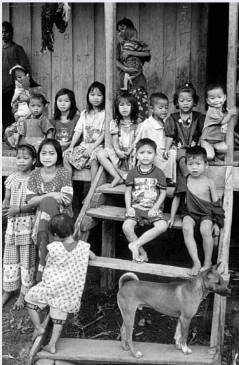
Anak-anak tumpuan masa depan, desa Long Titi, Kalimantan Timur

suatu daerah dikuasai oleh banyak kelompok secara bergantian dan pergantian kekuasaan tidak selalu terjadi secara damai. Seperti halnya peraturan adat, sejarah juga bersifat dinamis dan tafsiran tiap saat akan berbeda.