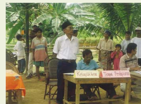
Panitia pemilihan anggota BPD Jambi