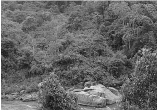
Hutan di Baru Pelepat