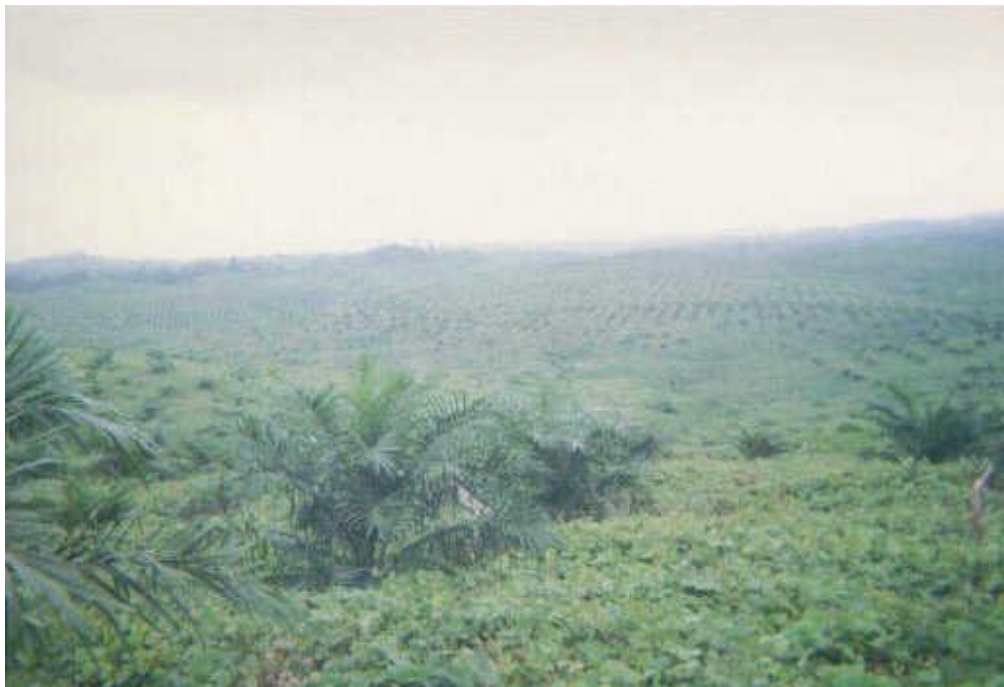
Berburu dimana? Banyak masyarakat Kab. Pasir menyesal lahan mereka penuh dengan kelapa sawit dan tidak ada ladang, buah-buahan atau hutan lagi

Pada kesempatan yang sama Pak Tondy menyarankan kepada wakil masyarakat Malinau seandainya kebun kelapa sawit masuk di Malinau, sebaiknya 1 rumah tangga mempunyai luas kebun