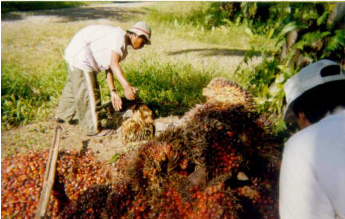
Petani Pasir periksa buah kelapa sawit

Menurut masyarakat Desa Bekoso, Damit dan Lempesu, penduduk asli Dayak Paser, sebelum ada kebun kelapa sawit mereka bisa hidup dengan baik karena masih punya lahan perladangan dan kebun buah-buahan yang luas. Tetapi setelah ada kebun kelapa sawit lahan perladangan tidak ada lagi karena penuh dengan kebun kelapa sawit, bahkan kampung mereka dikelilingi oleh sawit.